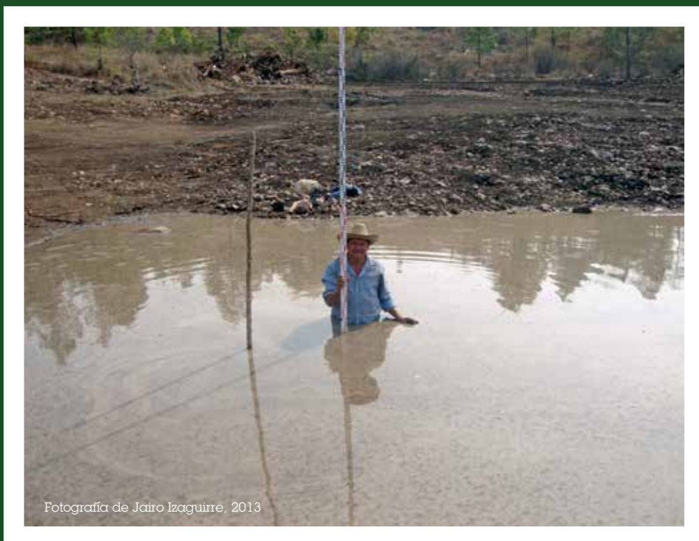
Fig. 5. Inicio de obra de captación de agua, Icalupe, Somoto, Nicaragua.